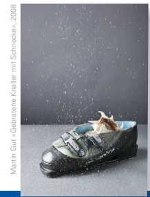
Martin Gur: Gebatene Kräuter mit Schnecke, 2008